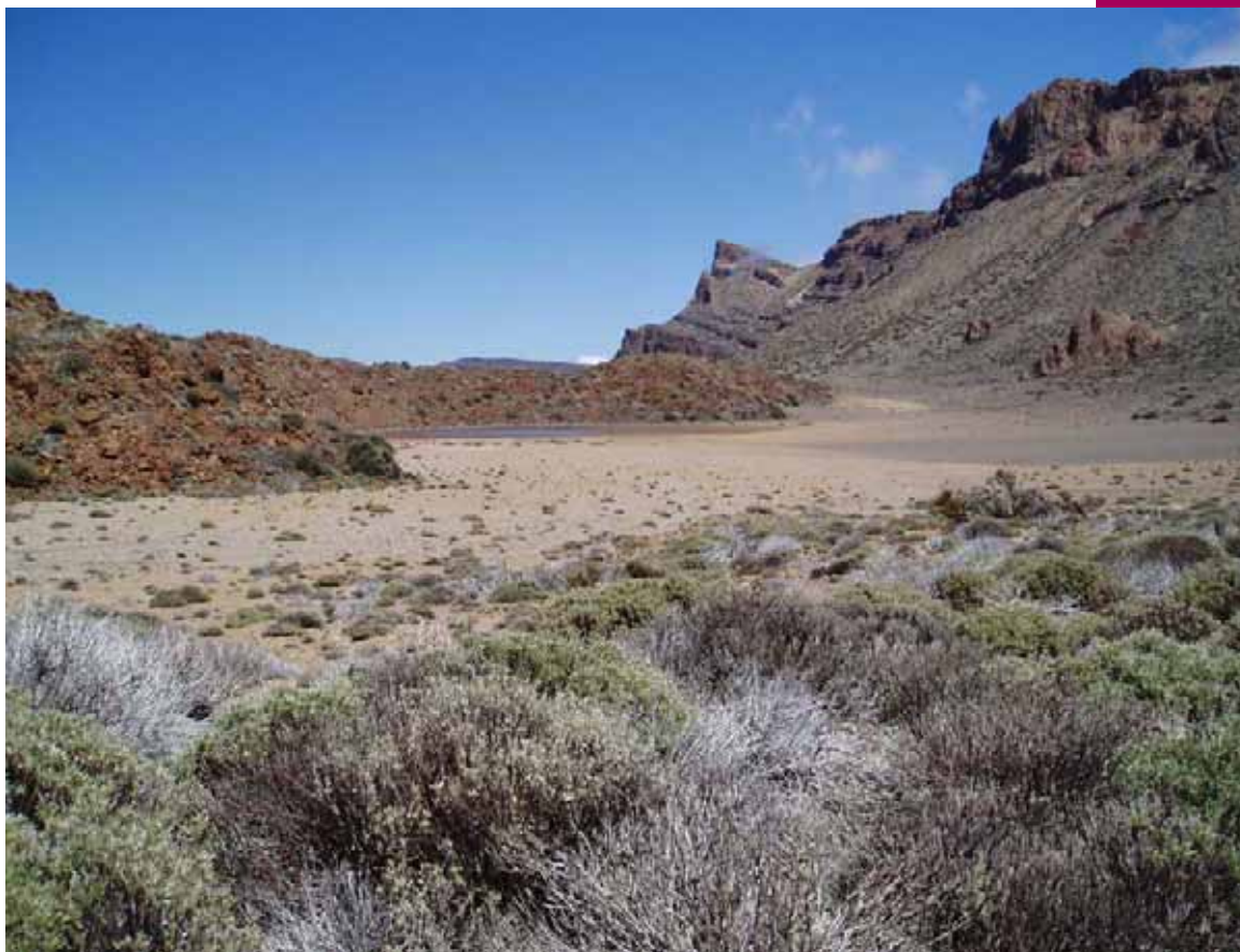
Pared y Cañada del Montón de Trigo