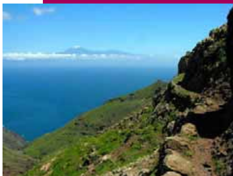
El Teide desde La Gomera

Finalmente, en los centros de visitantes y puntos de información se informa de la necesidad de conservar el Parque y de las limitaciones que implica su existencia. Este objetivo también se plasma en los programas de uso público que desarrolla la Administración. Asimismo, el material divulgativo que está a disposición del público en las distintas infraestructuras, incluye en su contenido la normativa por la que se rige este espacio natural protegido.