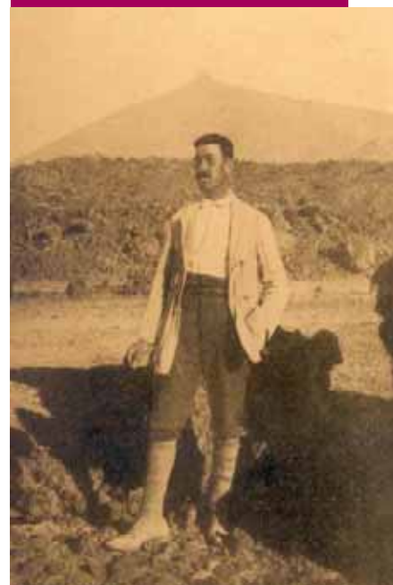
Primer guía de Las Cañadas