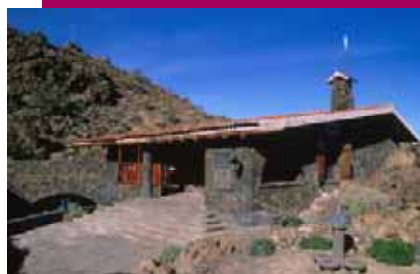
Centro Visitantes El Portillo

Situado en el acceso norte del Parque, este remodelado centro se encuentra instalado en una discreta construcción, de 705 m 2 de superficie entre las dos plantas, perfectamente adaptada al entorno. Con una superficie dedicada a exposición de unos 560 m 2 , su capacidad de carga instantánea es de 120 personas y en él se realiza una interpretación de los procesos y recursos naturales. Ayuda a comprender la historia geológica del Parque, la formación del paisaje, las adaptaciones de la flora y fauna al medio, las especiales características climáticas de la zona, etc. Destaca de este centro el audiovisual que sobre el origen de las Islas Canarias, en general, y de Las Cañadas y el Teide, en particular, se proyecta continuamente en su sala, que tiene una capacidad para sesenta y cinco (65) personas sentadas. Este Centro fue pionero en España, entrando en funcionamiento en el año 1977; dispone de aseos, tienda-librería y aparcamientos.