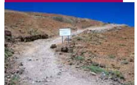
Sendero Montaña Blanca