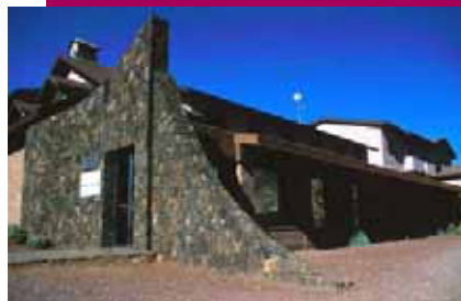
Centro Visitantes Cañada Blanca

Situado en un ala del edificio del Parador de Las Cañadas del Teide, en un enclave excepcional, frente a Los Roques de García. Con una superficie de 182 m 2 , posee una capacidad de carga instantánea de 55 personas. Aquí se hace una interpretación de la interacción hombre-Cañadas, se nos muestra la evolución de los diferentes modos de vida a lo largo de la historia, de los usos que se hacía del medio y de la larga historia de investigación desarrollada en el Teide. Dispone de aseos, tienda-librería y aparcamientos. Actualmente se está ampliando con la construcción de una sala de proyección semienterrada.