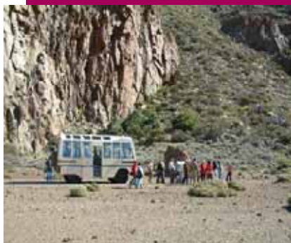
Rutas guiadas en vehículo