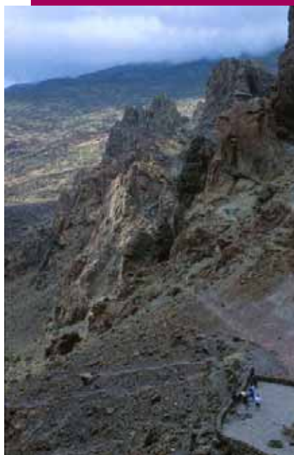
Mirador de La Ruleta

altitud de unos 1.600 metros y bajo la influencia de los vientos alisios, reúne grandes posibilidades didácticas, que la hacen idónea para el desarrollo y reforzamiento de la educación ambiental. De hecho, es muy utilizada por los centros docentes de la Isla, mayoritariamente, para llevar a cabo actividades relacionadas con el conocimiento del medio y la conservación de la naturaleza, actuando en ocasiones incluso como aula práctica en donde se imparten la totalidad de las áreas docentes. Tiene una capacidad de ochenta (80) plazas.