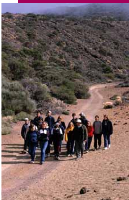
Charla a escolares

La población de las Islas Canarias es eminentemente joven; además, los centros de enseñanza proporcionan un ambiente y unas infraestructuras que facilitan el desarrollo de actividades de cualquier índole con niños y jóvenes. Se deduce, por tanto, que una buena planificación de la educación ambiental dirigida a este sector de la sociedad, conlleva formar en temas ambientales a gran parte de la población, que constituye el grueso de los ciudadanos y gobernantes de un futuro próximo.