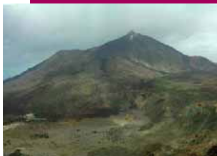
Teide desde Llano de Las Mesas

5. Regular y ordenar las visitas masivas de forma compatible con la conservación de los recursos y la divulgación de los valores del Parque.