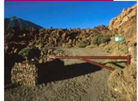
Barrera de acceso